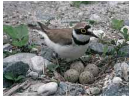
Gnieu dal pitschen rivaun cumin ( Charadrius dubius )