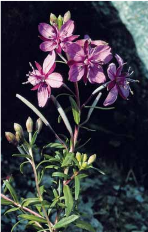
Veschla-chaura da flum ( Epilobium fleischeri )