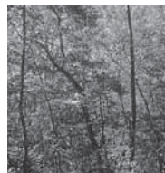
Gaud da plantas da lain dir (fraissen, ruver, tigl)