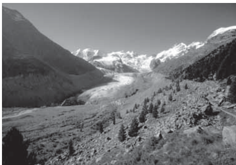
Vadret da Morteratsch (GR)

En las zonas alluvialas alpinas da l'inventari è la situaziun differenta: sulettamain 5 dals 66 objects han in reschim d'aua modifitgà, per exempel sut in mir da fermada.