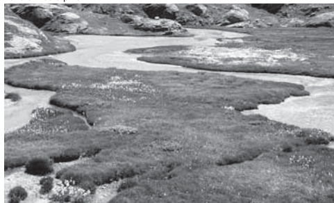
Zona umida alpina