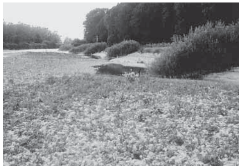
Suenter la revitalisaziun: colonisaziun dals novs bancs da glera da la Thur (TG)