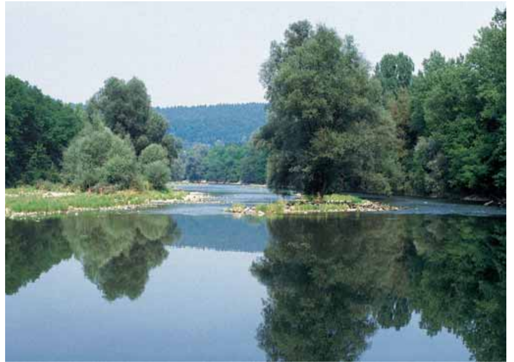
Umiker Schachen – Stierenhölzli a Brugg (AG)