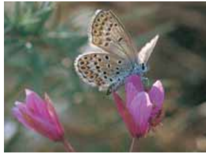
Blauet da ginestra ( Lycaeides idas ) sin veschla-chaura da Dodonaeus ( Epilobium dodonaei )