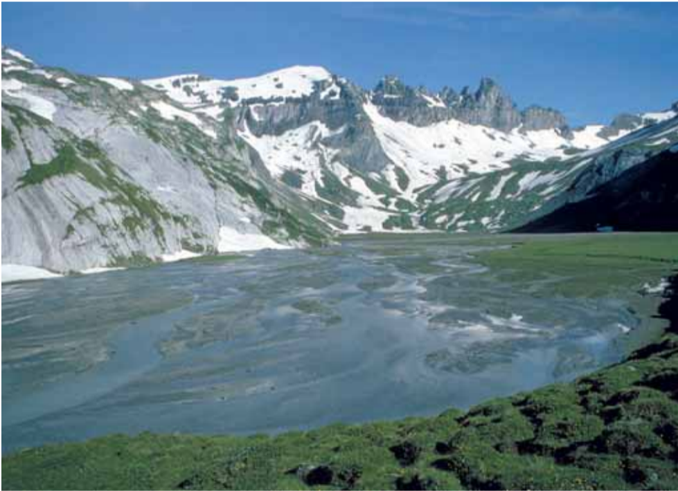
Plaun Segnas Sut (GR)