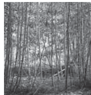
Gaud da plantas da lain lom (ogna)