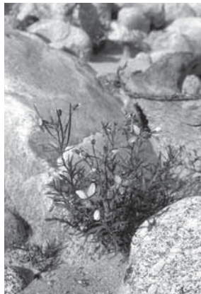
Zona da pionier

En las zonas alluvialas da la Svizra èn vegnidas registradas enfin oz da quai da 1200 spezias da plantas . Il dumber effectiv dastgass però muntar a passa 1500 spezias, quai che correspundess a la mesadad da la flora svizra sin in spazi d'in mez pertschient da la surfatscha svizra. La diversitad da la fauna è sumeglianta a quella da la flora. Tgirallas, libellas e salips sa servan da divers ambients da viver en il decurs da lur ciclus vital; ils amfibis ed ils peschs , numerus utschels e mammals chattan là preda, protecciun e refugi.