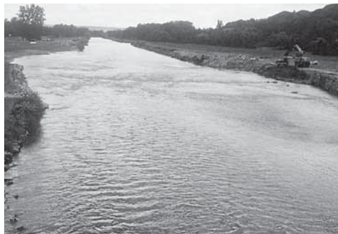
Lavurs da revitalisaziun: schlargiament dal letg da la Thur (TG)